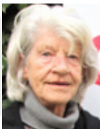
5 Nel Dol