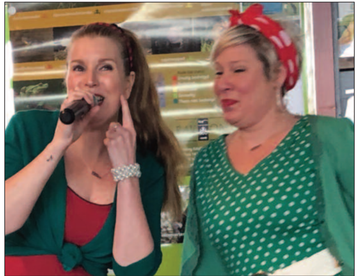
Bl!tzz: Close harmony with a smile