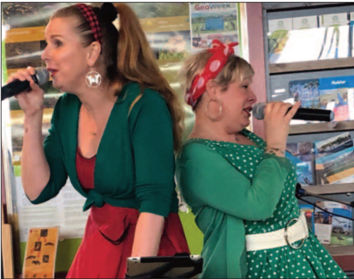
Het maffe meiden duo Blitzz gaf swingende shows, met evergreens uit de Rock & Roll en Ballads