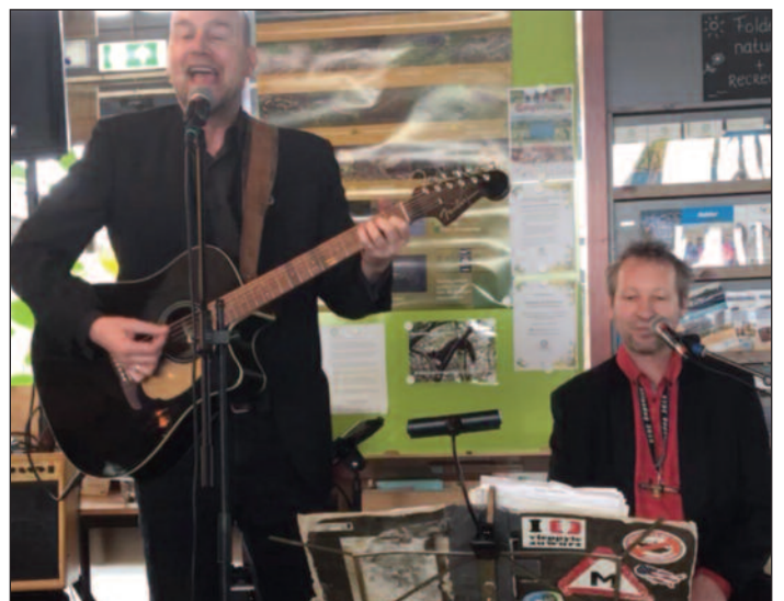
Een GroenLinks strijdlid, waar we allemaal hoop en energie van moeten krijgen, ook in deze tijd: https://youtu.be/yavzs8Lwu_M