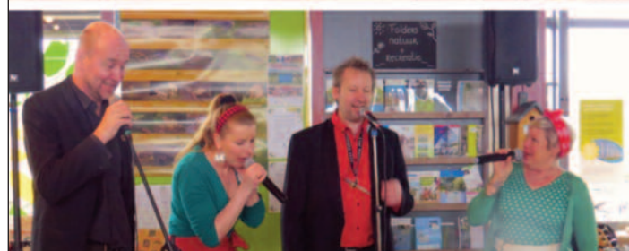
Spontane samenzang van de bands, met California Dreaming