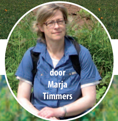
door Marja Timmers

Plezieriger en beschutter fietsen langs de Langevliet, met ook enkele schuilplaatsen. Goed voor het milieu, dankzij het planten van: