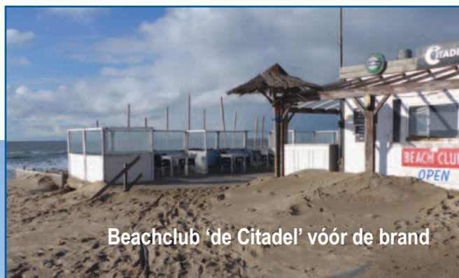
Beachclub 'de Citadel' vóór de brand

Het strandpaviljoen 'Citadel' is 3 feb. 2015 helaas door brand verwoest. Deze foto is van eerdere datum. De oude situatie was niet toegankelijk en ook ontbrak een rolstoeltoilet. Wij hopen dat in een nieuw paviljoen een goede toegankelijkheid (met invalidentoilet!) gerealiseerd wordt.